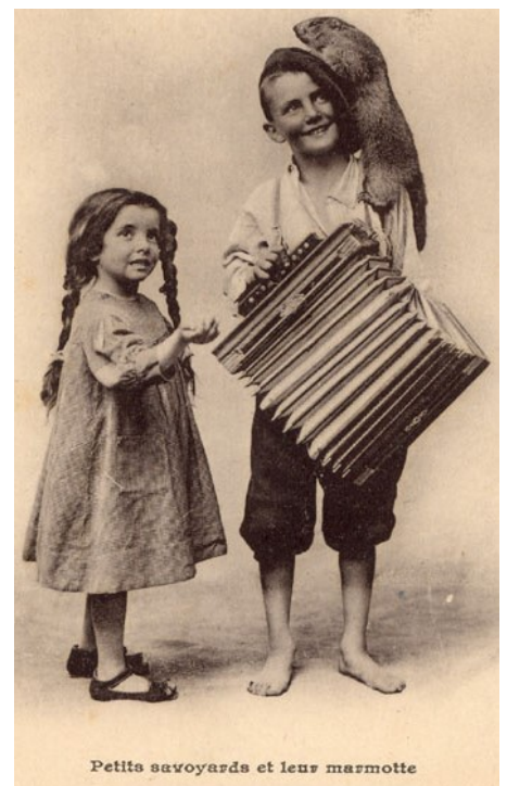
Enfants de la montagne, montreurs de marmotte

Dénoncée à la Belle Époque, l'exploitation des enfants au travail, et notamment des petits étrangers, est une réalité dans les usines françaises, en dépit d'une législation mise en place à partir de 1841.