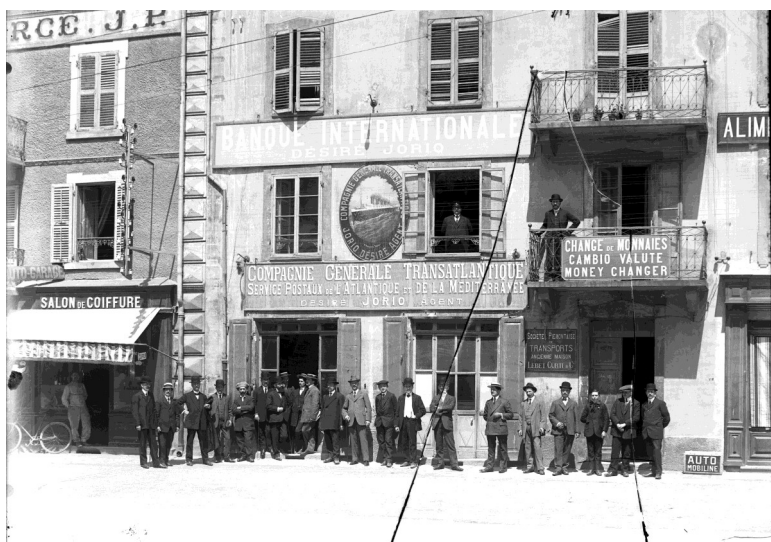
Le comptoir de la Compagnie générale transatlantique à Modane

La France, la Suisse et la Belgique sont les destinations privilégiées des populations du nord de l'Italie, mais l'essor des moyens de transports permet de partir plus loin : les gares ferroviaires des Alpes deviennent des lieux de passage importants pour des migrations au long cours vers un autre continent : l'Amérique.