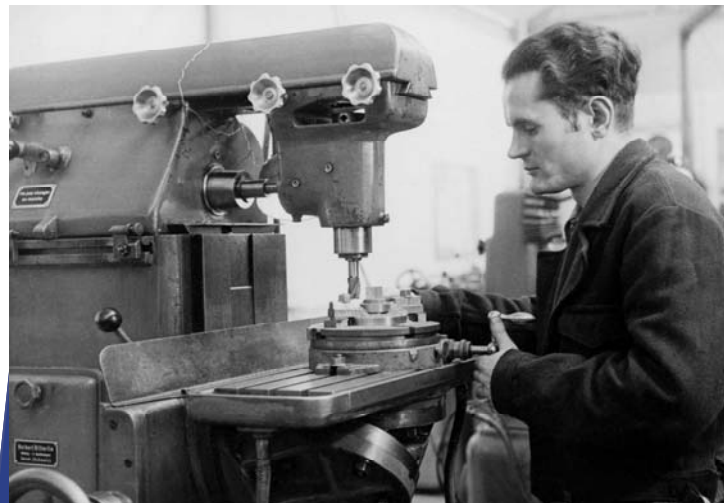
Centre horloger de Valence

À la fin des années 1970, des milliers de boat-people vietnamiens, cambodgiens ou laotiens sont contraints de fuir leur pays sur des embarquements de fortune. Après de longues traversées, souvent périlleuses, ces personnes trouvent asile dans des pays loin de chez eux. Dans les années 1990, c'est le sort des réfugiés bosniaques, fuyant les massacres de l'armée serbe, qui provoque un vent de solidarité en France. Dans la Drôme, des particuliers hébergent des familles, des associations sont créées... Le relais médiatique sensibilise au sort difficile de ces nouveaux arrivants.