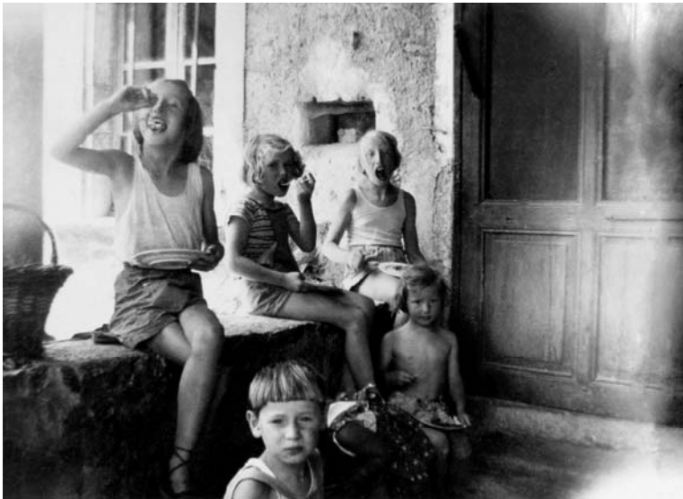
Réfugiés allemands dans la Drôme

La Première Guerre mondiale constitue un tournant : les violences grandissantes à l'égard des civils jettent des foules immenses sur les routes d'Europe. La correspondance de la préfecture de la Drôme et des maires des communes témoigne de la situation d'urgence dans laquelle ces arrivées sont gérées. Des lettres de réfugiés évoquent le sentiment de gratitude à l'égard de la terre d'accueil, mais aussi les difficultés à surmonter le traumatisme de l'exil.